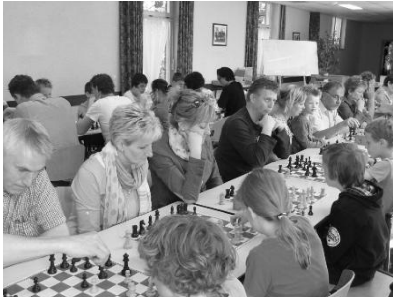
Enorme drukte tijdens familieschaak 2013.

Het traditionele familieschaak van SV Leudal werd gehouden op 28 april en was een geweldige happening. Het aantal ouders en overige familieleden overtrof de verwachtingen. Er waren meer gasten dan eigen spelers.