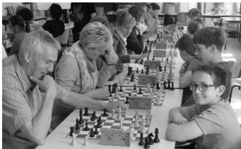
Er werd enorme strijd geleverd!

Nadat de gasten eerst bekend werden gemaakt met de schaakklok en voorzien van enkele nuttige tips betraden ze vastberaden de arena, om de jeugd van SV Leudal het zo moeilijk mogelijk te maken. En dat lukte. Toch waren de eigen jeugdspelers erg sterk. De eerste ronde werd door de SV Leudal spelers met 12-5 gewonnen. Maar daarna kwamen de ouders steeds beter in hun spel. De tweede ronde werd weliswaar ook gewonnen door de jeugd maar de stand was dit maal 10-7.